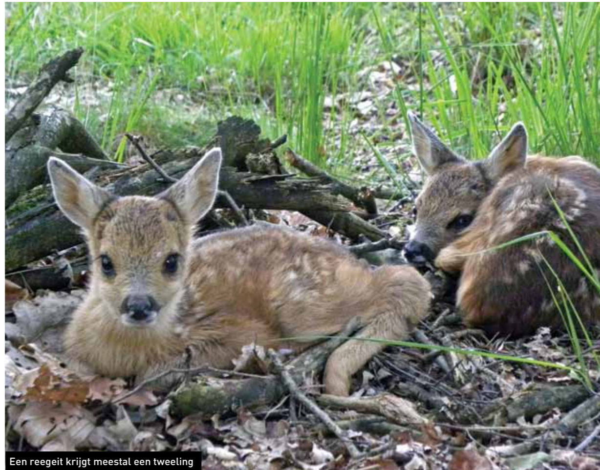
Een reegeit krijgt meestal een tweeling