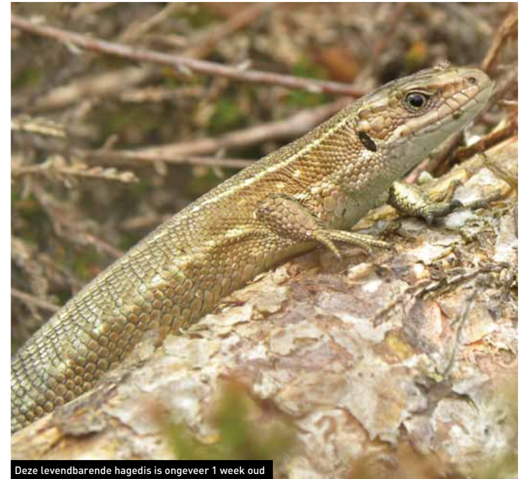
Deze levendbarende hagedis is ongeveer 1 week oud