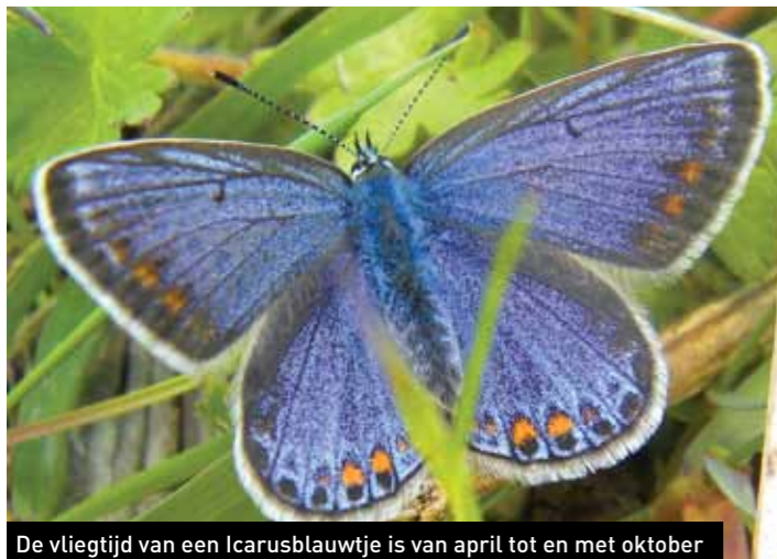
De vliegtijd van een Icarusblauwtje is van april tot en met oktober