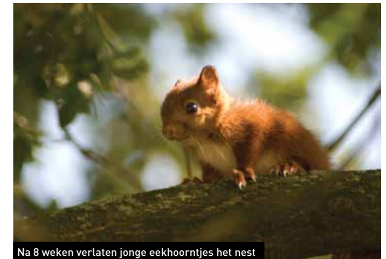
Na 8 weken verlaten jonge eekhoortjes het nest