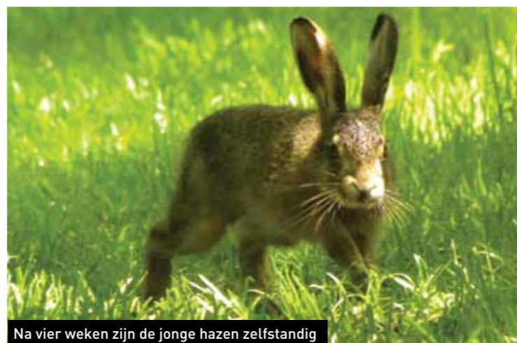
Na vier weken zijn de jonge hazen zelfstandig

Tussen deze twee gemeenten liggen twee prachtige heidegebieden; de Bussumerheide en de Westerheide. Samen zijn ze het grootste aaneengesloten heideveld van het Gooi. Hier leven de dieren die op deze pagina zijn afgebeeld. De Hilversumse fotograaf Ben Walet is bijna dagelijks op de heide te vinden en heeft de dieren vastgelegd. Zijn foto's zijn in twee kleuren metselwerk uitgevoerd op de kopgevels van de woningen aan de Leemkuilen en de Comes Oolenstraat in Hilversum.