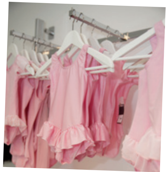
Klanten zijn heel divers