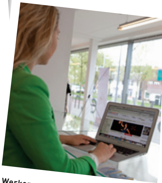
Werken en wonen gecombineerd