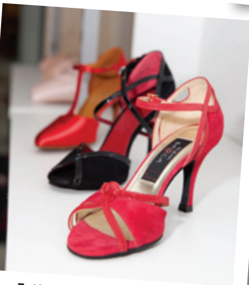
Zelf op hoog niveau gedanst