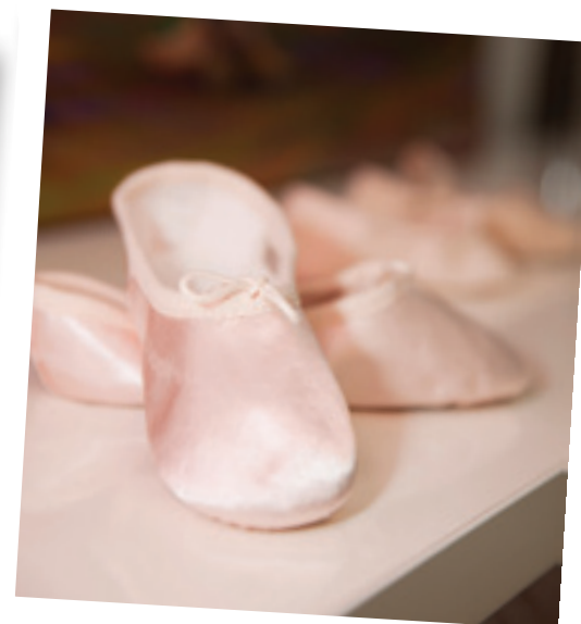
Mijn grote passie