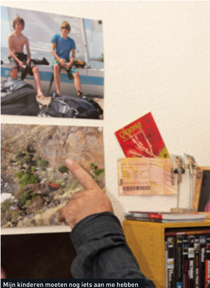
Mijn kinderen moeten nog iets aan me hebben