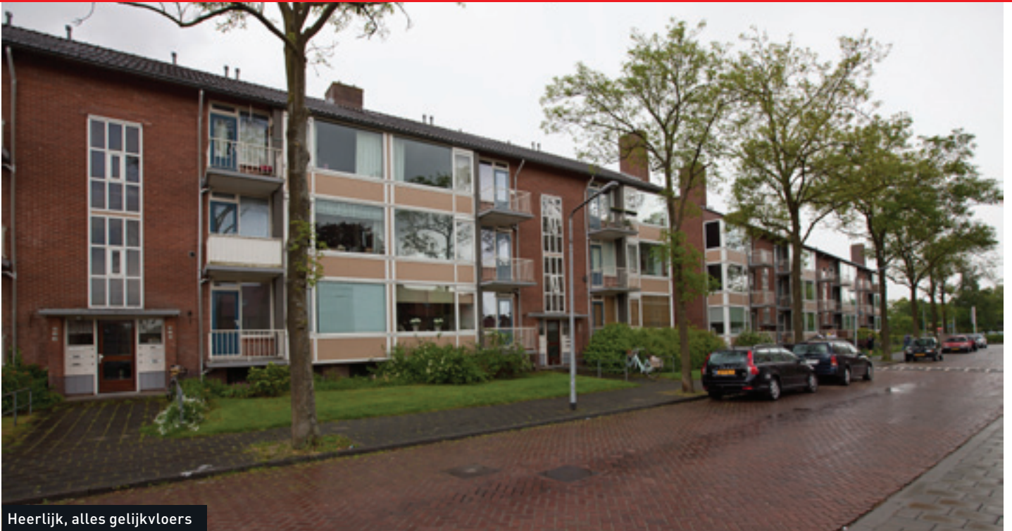
Heerlijk, alles gelijkvloers