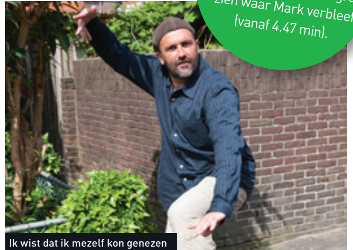
Ik wist dat ik mezelf kon genezen