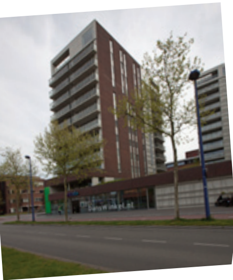
Een fijne werkruimte