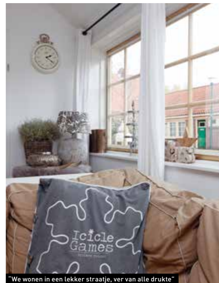
“We wonen in een lekker straatje, ver van alle drukte”