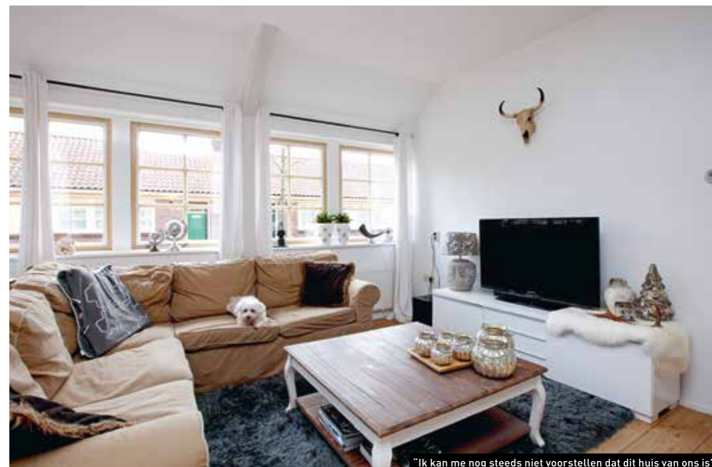
“Ik kan me nog steeds niet voorstellen dat dit huis van ons is”